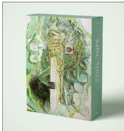
Vues de la boîte Civil Hope , tome 2 [couverture et dos].

Ouvrage co-édité avec la Maison Salvan (Labège) et le Mrac Occitanie, Musée régional d'art contemporain (Sérignan).