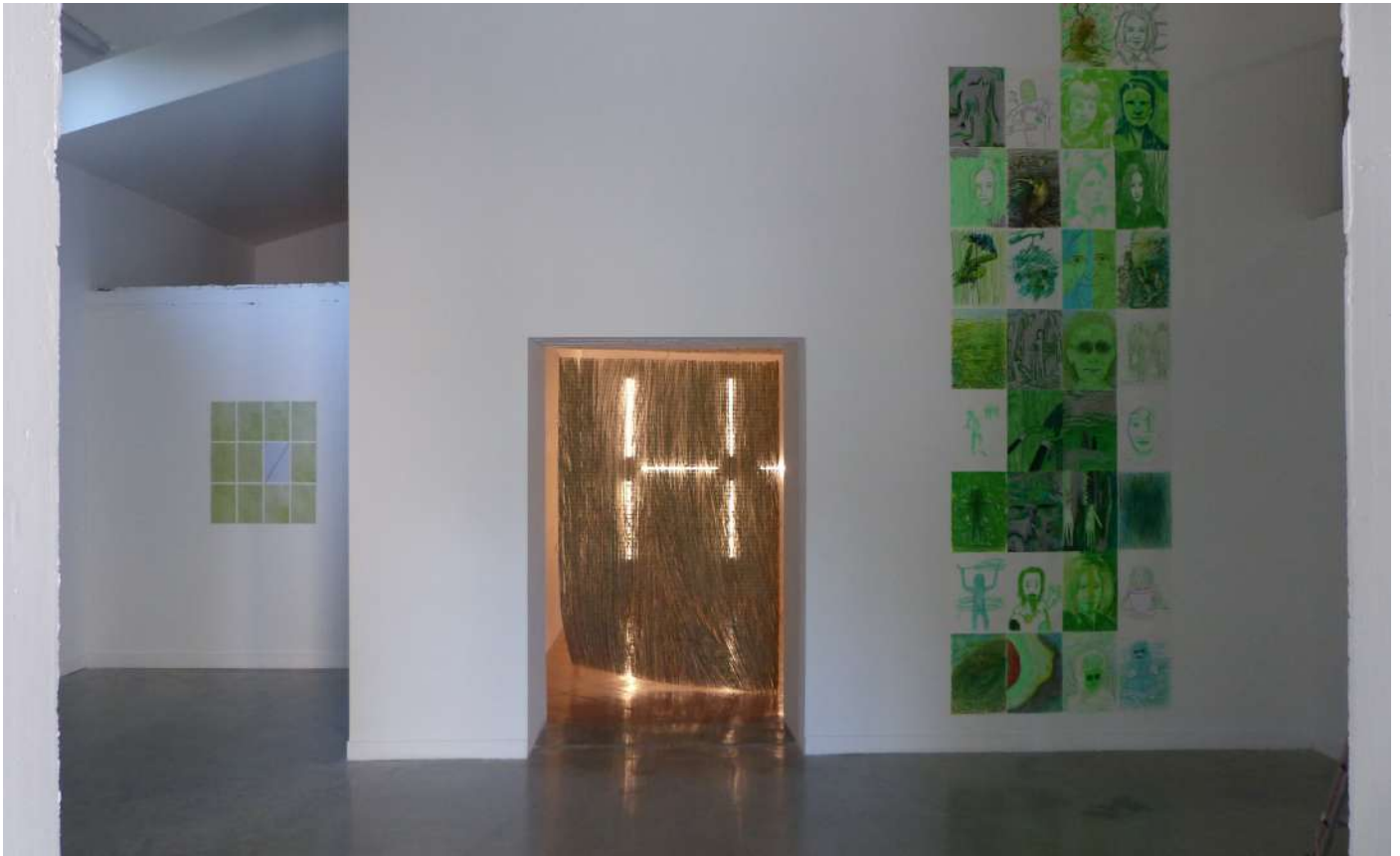
Vue du montage de l'exposition, 2023 © Maison Salvan.