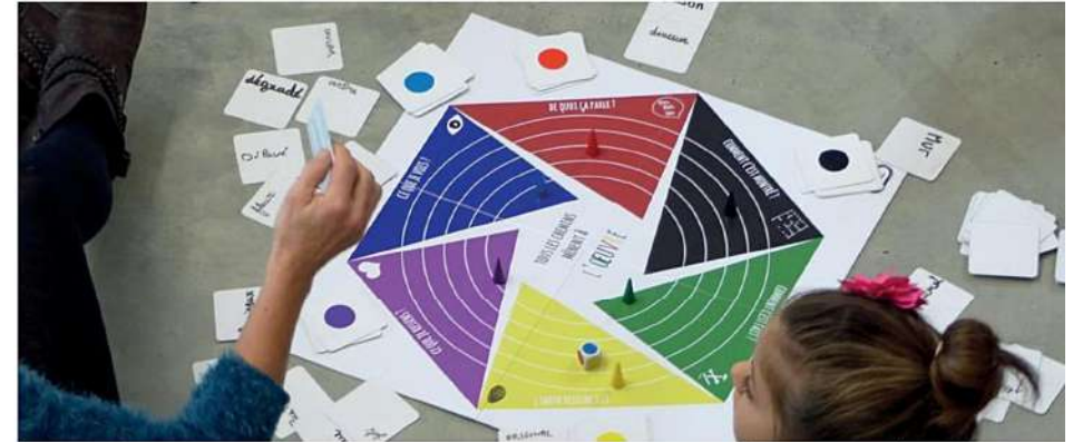
Activation du jeu au cœur de l'exposition Destinée Cherche Propriétaire

Ce jeu n'est qu'un prétexte à favoriser l'échange de paroles autour de l'art. En ce sens, n'hésitez pas à inventer vos propres règles !