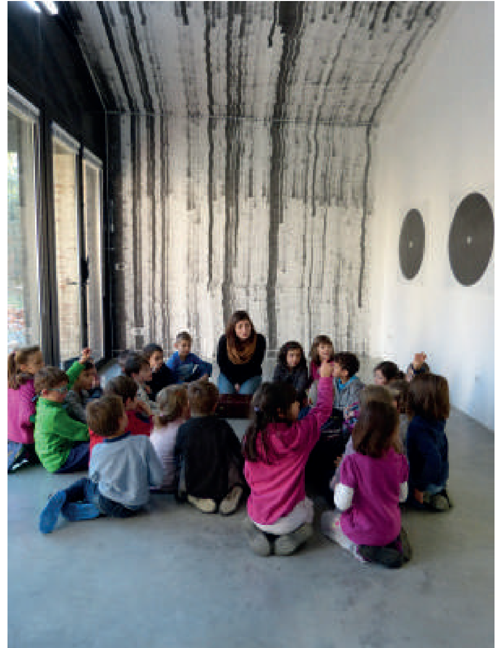
Accueil d'une classe dans le cadre de l'exposition « L'écoulement du paysage » en 2015 © Maison Salvan.

L'invitation étant faite, préparez-vous à organiser une visite à la Maison Salvan avec votre classe pour venir y découvrir une exposition avant la fin de l'année scolaire !