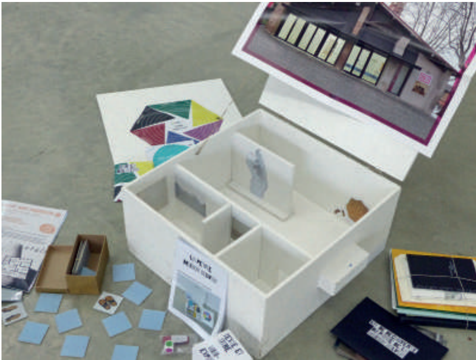
« La Petite Maison Salvan » © Maison Salvan.