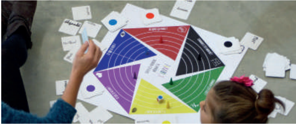
Activation du jeu au cœur de l'exposition Destinée Cherche Propriétaire.

Ce jeu est un moyen ludique pour inviter les enfants (et adultes aussi !) à dialoguer autour des œuvres d'art contemporain. Il s'utilise surtout au cœur d'une vraie exposition !