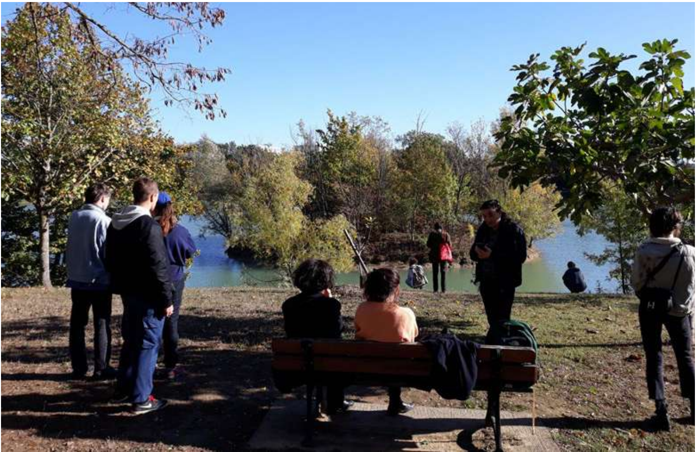
Visuel : « Les territoires du travail », 2019

En partenariat avec l'isdaT (institut supérieur des arts de Toulouse)