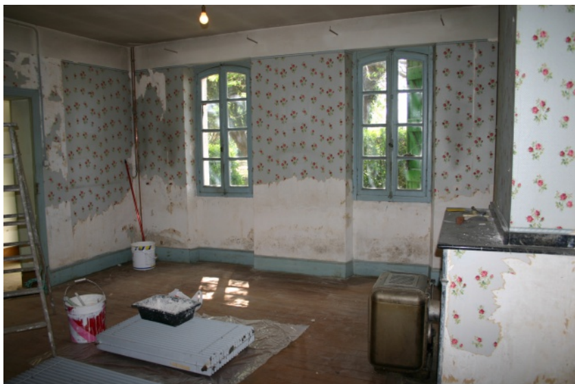
Ci-dessus : Vue de la salle de la cheminée pendant les travaux

Enfin, au centre, toujours dans cet esprit fantaisiste, se trouve un poster double représentant les artistes vainqueurs du grand concours de la Maison Salvan (cf. page 7).