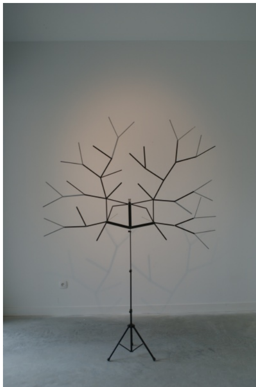
Ci-contre : exemple d'oeuvre utilisé comme sticker (c) Carl Hurtin