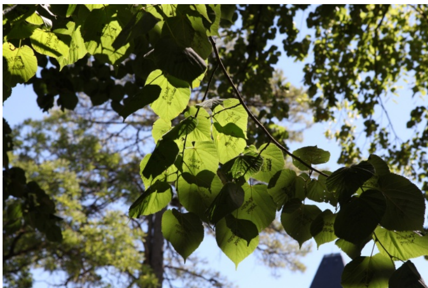
Vent d'est, 2011, (c) Estefanía Peñafiel Loaiza

Dans le même temps, l'exposition de Estefanía Peñafiel Loaiza, en résidence à partir de mai à la Maison Salvan, est ouverte à tous entre les murs du centre d'art.