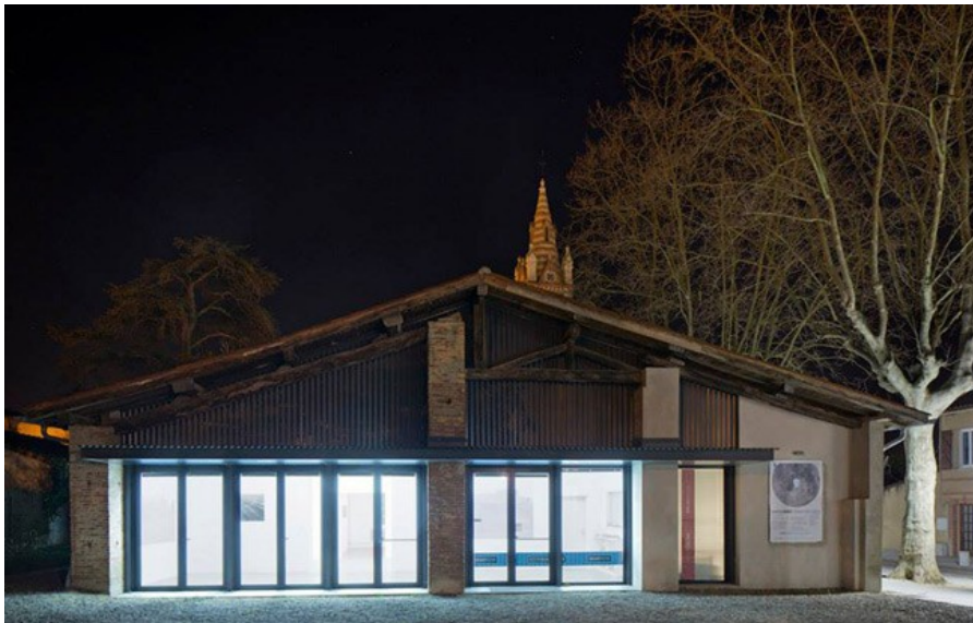
La Maison Salvan de nuit

Au travers de son action, la Maison Salvan défend l'artiste et la création. Cela s'accompagne d'un travail de médiation indispensable, qui permet la rencontre entre le public et l'artiste, la découverte de son travail, son parcours, ses incertitudes et ses intentions tout au long de sa résidence. Depuis dix ans, ce lieu accueille des artistes en résidence entre ses murs, créant un attachement particulier entre la Maison Salvan, les artistes et le public.