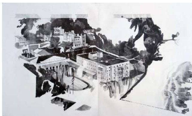
Marc Bauer, Grand Hôtel, dessin, 2010.

Partant de l'histoire vraie d'une femme dont le mari journaliste est mort en Irak, l'artiste fait rejouer de mémoire cette histoire par six acteurs. Le récit se déforme et s'altère au fil de leurs interprétations. Par ce biais, il questionne tout autant le pouvoir des médias à tordre le réel que leur capacité à introduire dans nos mémoires collectives des fictions revendiquées comme des vérités.