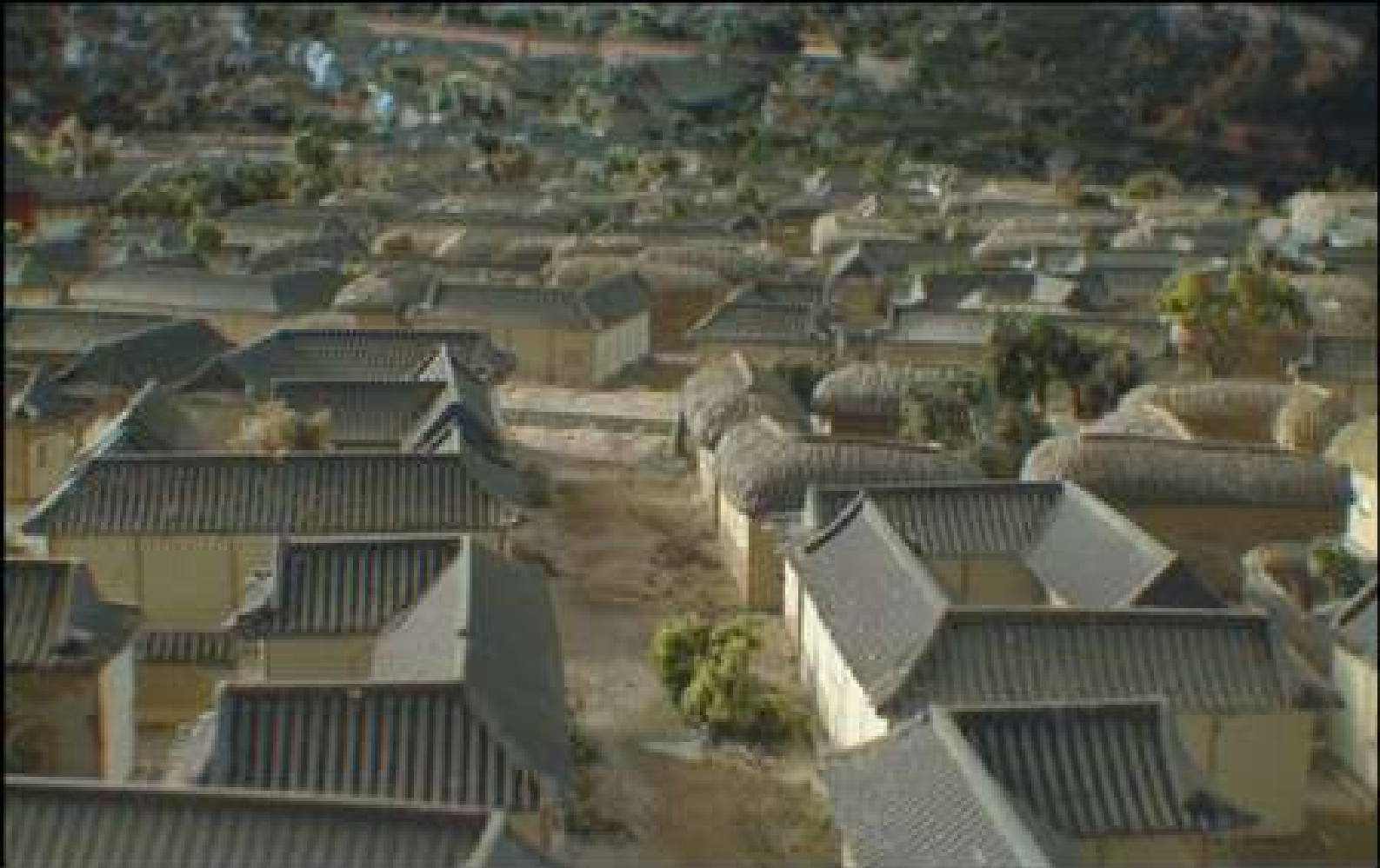
A day in life of Gubo © Yeondoo Jung