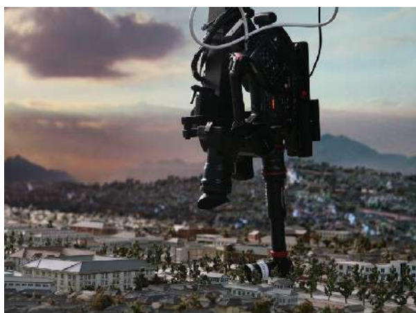
A day in the life of Gubo © Yeondoo Jung.