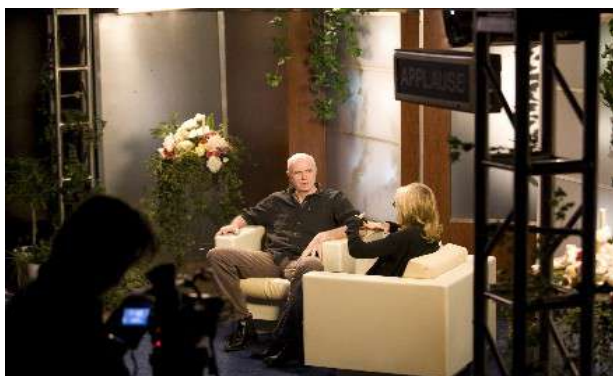
Omer Fast, Talk Show, vidéo, 2009.

Partant de l'histoire vraie d'une femme dont le mari journaliste est mort en Irak, l'artiste fait rejouer de mémoire cette histoire par six acteurs. Le récit se déforme et s'altère au fil de leurs interprétations. Par ce biais, il questionne tout autant le pouvoir des médias à tordre le réel que leur capacité à introduire dans nos mémoires collectives des fictions revendiquées comme des vérités.