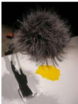
Froissements entre paysages sonores et paysages alimentaires : JDM#2. Mix'Art Myrys, mai 2015, Toulouse.

À partir du 15 avril, la résidence / performance de Denise Bresciani et Ilias Liosatos viendra combler l'espace non investi par l'exposition de Yeondoo Jung. Ce duo artistique sera en courte résidence de travail à la Maison Salván. Une performance artistique (le vendredi 29 avril à 19h) viendra clore la résidence. Elle interrogera les liens entre la transformation des aliments et le son par le biais de dispositifs ouverts à l'expérience collective. Le temps de résidence / performance permettra aux artistes de poursuivre leur collaboration sous la forme d'un laboratoire de recherche qui sera, parfois, ouvert au public.